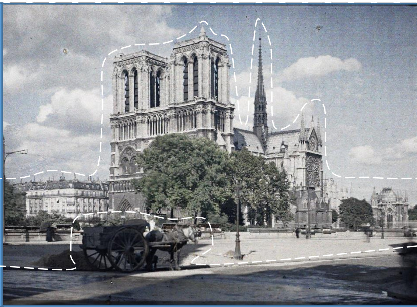
La cathédrale Notre-Dame, Paris (IVe arr.), France. 8 juillet 1914, Georges Chevalier. A 7 393