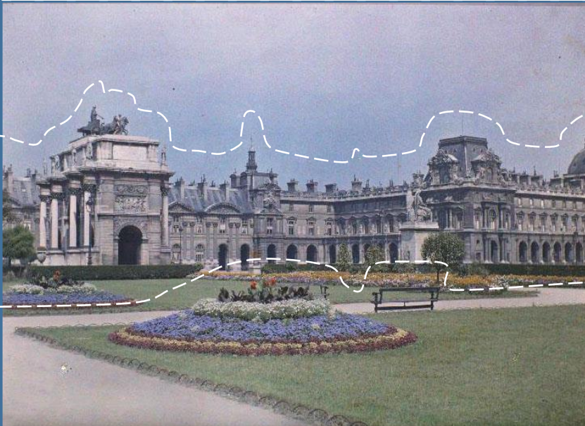
Le Louvre et l'Arc de Triomphe du Carrousel, Paris (Ier arr.), France. 8 août 1920, Georges Chevalier. A 23 063