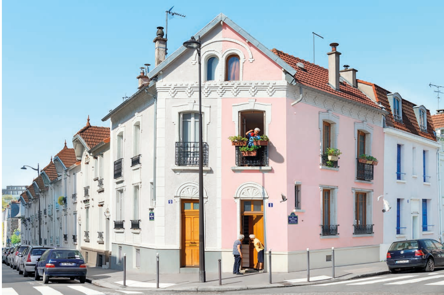
© Thierry Bouët, 1 rue Ernest et Henri Rousselle, Paris 13 e , Série Paris#1, 2018