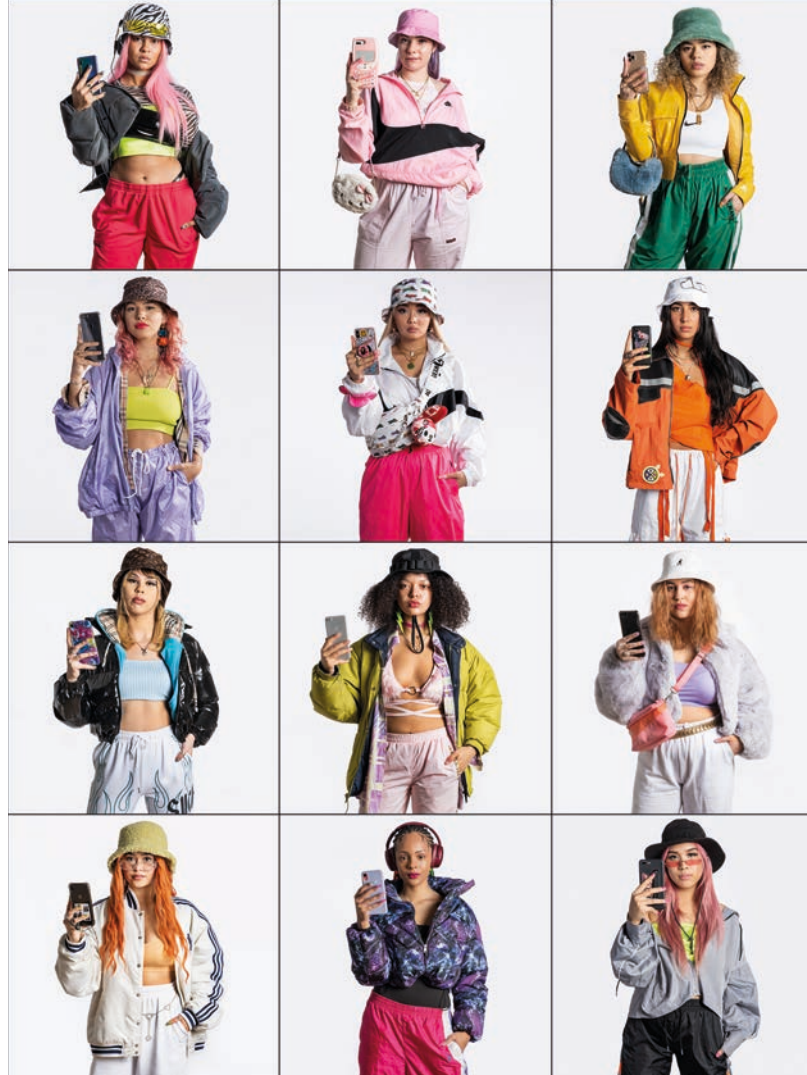
© Ari Versluis & Ellie Uyttenbroek, 171. Me-mies, Rotterdam, Pays-Bas, Série Exactitudes , 2020