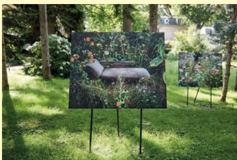
Siân Davey Mondes en commun, 2025

Le festival propose 11 accrochages photographiques d'une dizaine de tirages chacun qui se déploient sur l'ensemble du site, principalement en extérieur. Différents emplacements, formats et accrochages, pensés sur mesure pour chaque série, permettent d'interpréter ces images par des regroupements ou des confrontations et de les faire dialoguer avec le jardin.