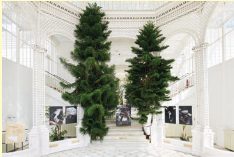
Aurélié Scouarnec Mondes en commun, 2025