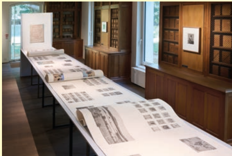
Claude Iverné Mondes en commun, 2025