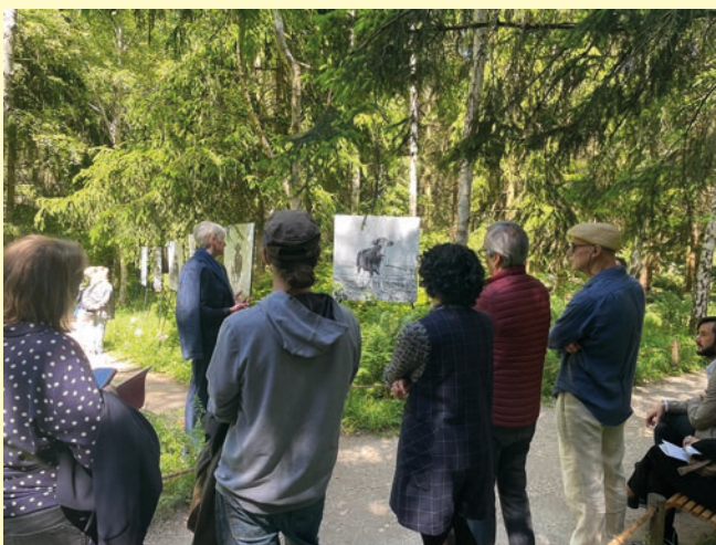
Visite du festival en 2025