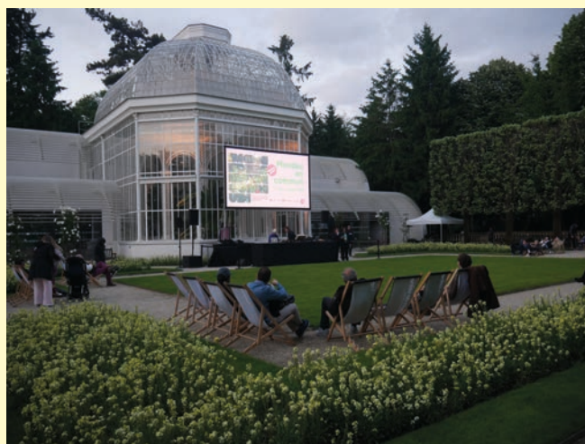
Projection en musique en 2025

La programmation complète est à retrouver en ligne :