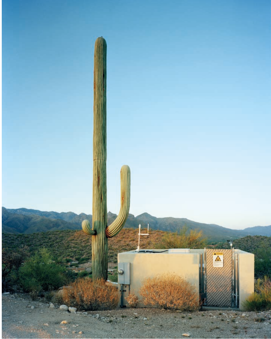
© Robert Voit, Scottsdale, Arizona, USA, Série New Trees , 2006