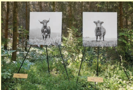
Ursula Böhmer Mondes en commun, 2025