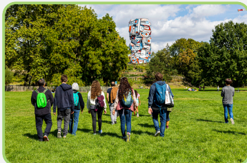
©Jean Dubuffet, la Tour aux figures, ©ADAGP CD92/STEPHANIE GUTIERREZ-ORTEGA

Toutes les infos : www.hauts-de-seine.fr/le-parc-de-lile-saint-germain