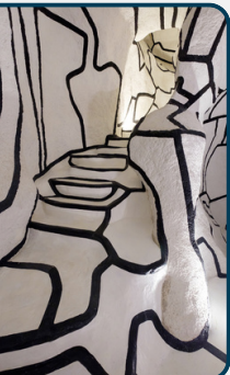
Jean Dubuffet, la Tour aux figures, ©ADAGP CD92/WILLY LABRE

Infos et réservations : www.tourauxfigures.hauts-de-seine.fr