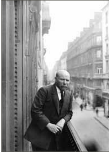
Portrait d'Albert Kahn

Albert Kahn est né en 1860 dans un village d'Alsace et mort en 1940 dans sa maison à Boulogne-Billancourt. Il est témoin de trois guerres durant sa vie.