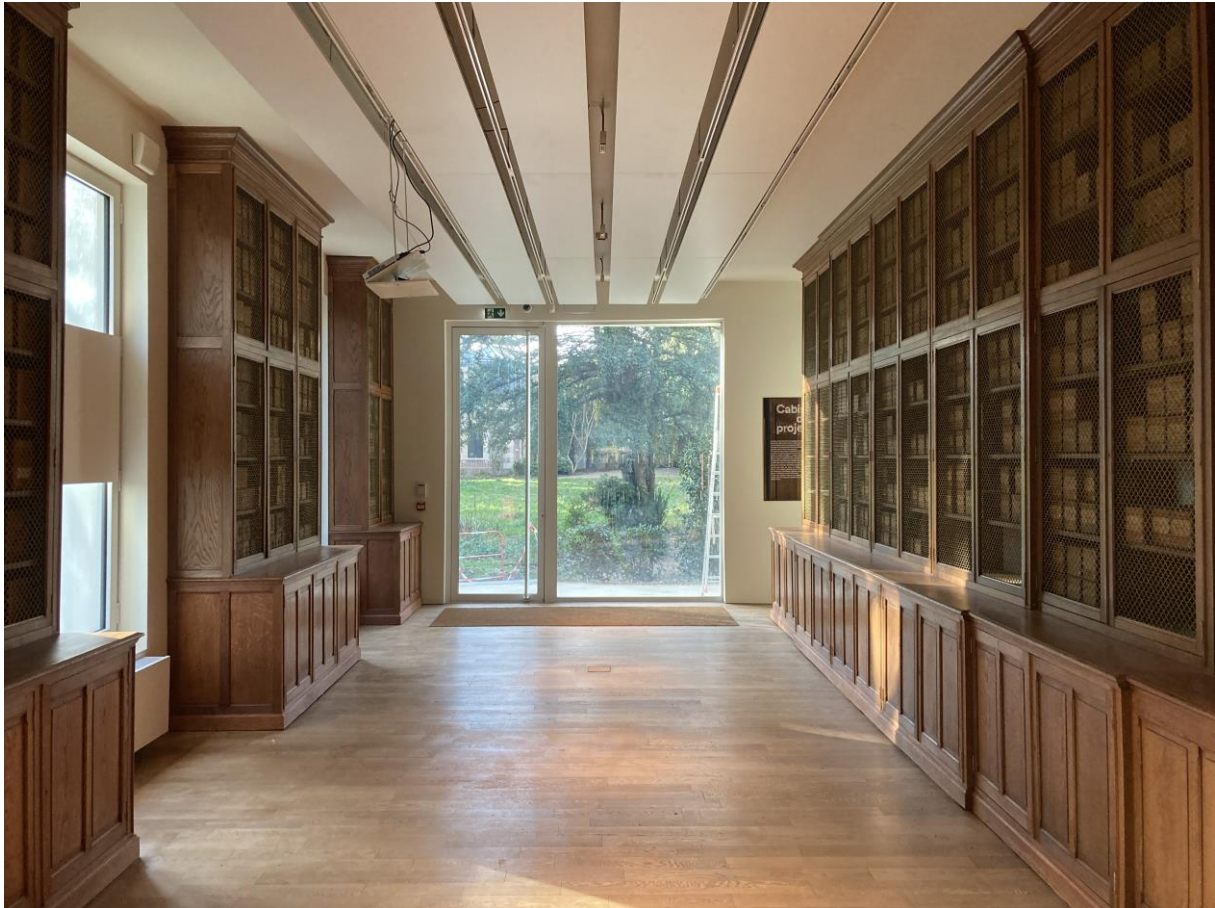
Vue de la salle des Plaques

Intégrée dans le jardin, la salle dite « des Plaques » est le lieu où, à la fin des années 1920, les plaques autochromes produites par les opérateurs des Archives de la Planète étaient classées et conservées. Ce lieu, inscrit dans le parcours de visite du musée, est nouvellement ouvert au public. Aménagé selon le dernier état connu au temps d'Albert Kahn, cet espace est un lieu de mémoire qui rend compte de l'entreprise d'archivage du monde initiée par le banquier.