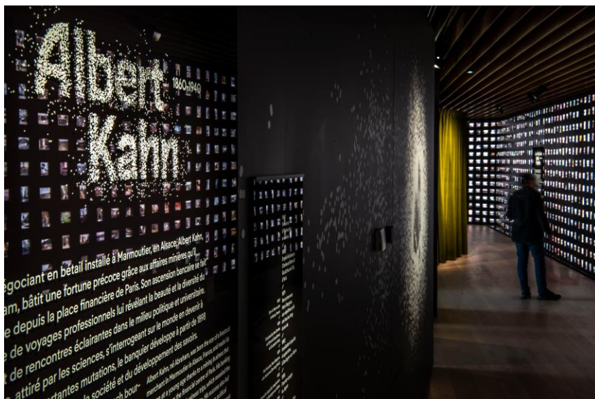
vue de l'exposition permanente

La mobilisation de la dimension spectaculaire inhérente aux modes de diffusion d'origine -l'autochrome comme le film avaient vocation à être projetés, confrontant et juxtaposant images en couleurs et images animées, permettra immersion et émerveillement.